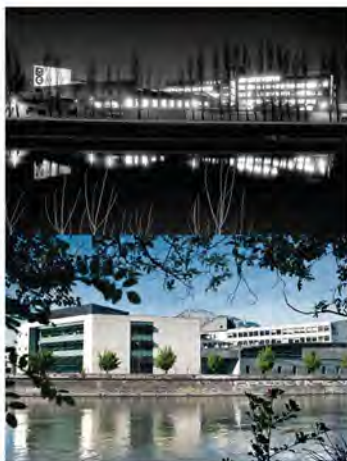
Merlin Gerin devenu Schneider Electric, à Grenoble.