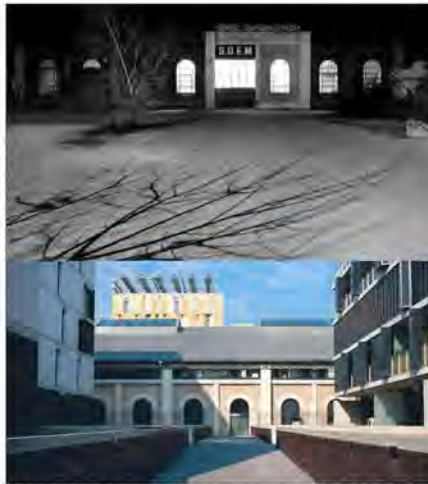
La Société dauphinoise d'études et de montages était installée à Bouchayer-Viallet à Grenoble ; elle a déménagé à Voreppe. Le site, lui, a été complètement rénové.