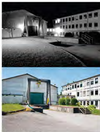
Satma PPC, à Goncelin.