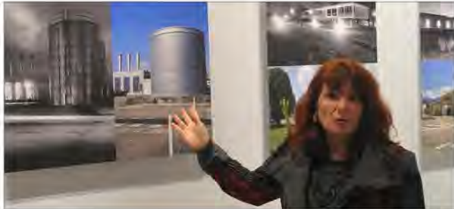
▲ La photographe Anne-Marie Louvet est revenue vingt ans après sur les sites des entreprises qu'elle avait photographiés en 1991.