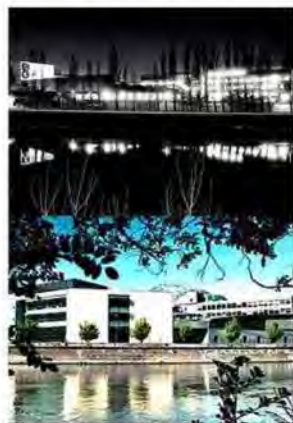
Merlin Gerin 1991_Schneider Electric 2013 © Anne-Marie Louvet

Le musée de la Houille Blanche de Lancey propose jusqu'au 31 mai prochain, une nouvelle exposition, toujours ancrée dans le monde industriel comme le veut l'histoire de la maison Bergès. « Recadrage », se veut une galerie de photographies signées Anne-Marie Louvet, censée mettre en avant des entreprises en mouvement. Les lieux choisis ne l'ont pas été par hasard : il s'agit de 30 entreprises de Grenoble et de sa couronne, signalées en 1991 par la Chambre de commerce et d'industrie comme les plus performantes du département, qui avaient été photographiées de nuit ou en noir et blanc. Les grands secteurs alors prometteurs sont là : informatique, service à l'entreprise, ingénierie, recherche et développement, etc. Puis 22 années plus tard, la même artiste est retournée sur les lieux. Sur les nouveaux clichés, le cadrage reste approximativement le même, mais l'argentique a laissé la place au numérique et à la