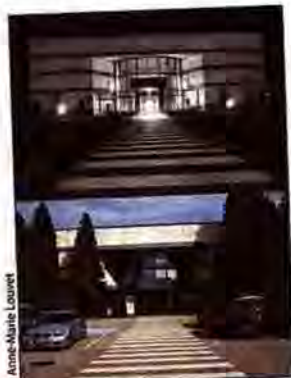
Hewlett Packard 1991-2013.

Jusqu'au 31 mai 2014, à la Maison Bergès - musée de la Houille Blanche, à Lancey. 04 38 92 19 60. Gratuit. www.musee-houille-blanche.fr