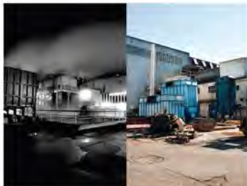
Wheelabrator en 1991, devenue Winoa, au Cheylas.