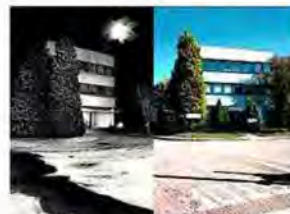
Ugimag 1991_Steelmag 2013