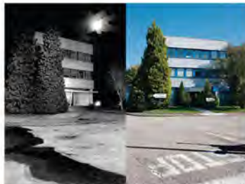
UGIMAG devenue Steelmag, à Saint-Pierre d'Allevard.